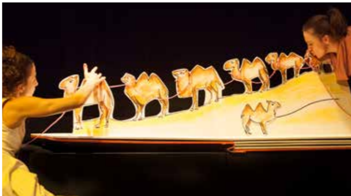
C ... WIE CHAMÄLEON

Termin ↗ So 18.3., 15.00 Uhr, Kleines Haus