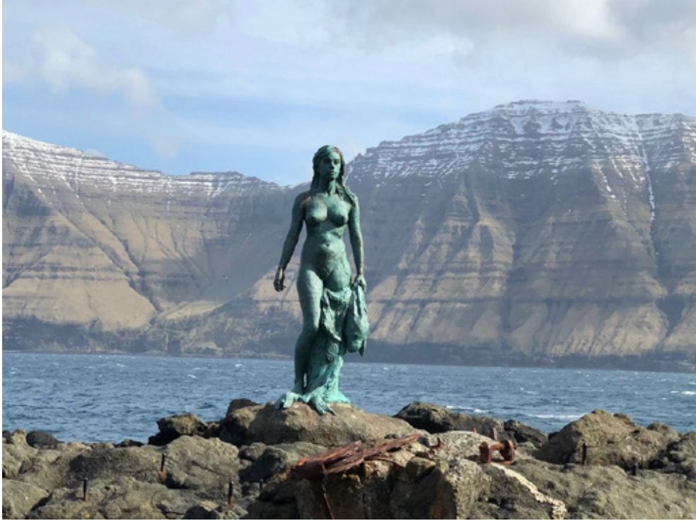
Seehundfrau von Mikladalur